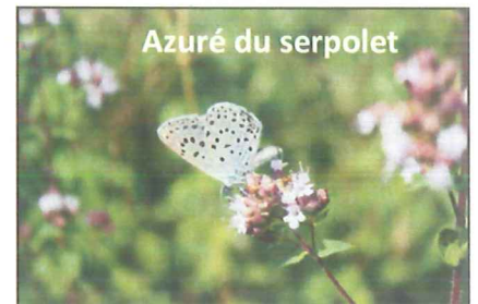
Azuré du serpolet

Au niveau des populations de libellules, de belles découvertes ont aussi été réalisées, avec la présence, de la Cordulie à corps fin et de la Cordulie splendide toutes deux protégées au niveau national ; du Gomphe à crochets et du Cordulegastre bidenté déterminants ZNIEFF.